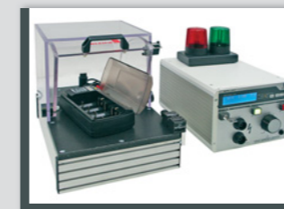
Hochspannungsprüfung unter einer Prüfhaube

Für komplexere Prüfaufgaben stehen nicht nur Einzelprüfgeräte sondern auch Kombinationsprüfgeräte mit interner automatischer Umschaltung zwischen den Prüfmethode zur Verfügung.