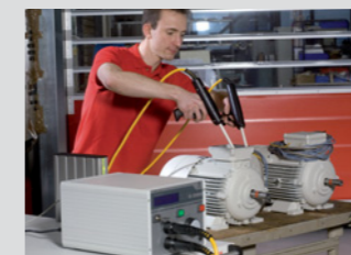
Prüfung mit Pistolen