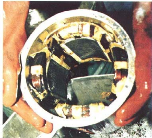
2) Na 10 minuten dompelen zijn de resultaten al zichtbaar. Het grootste deel van de vervuiling is reeds verwijderd.