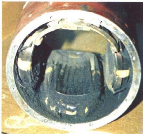
1) 24 kW Stator. Zeer zwaar vervuild met koolstof.