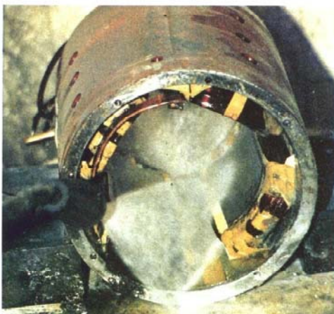
3) Tijdens het afspuiten, zult u merken, dat al het resterende materiaal wordt verwijderd d.m.v. het "schuimen".