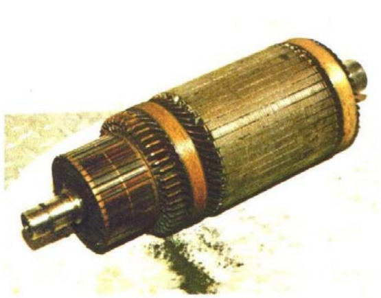
1) 24 kW Anker. Is zwaar vervuild met koolstof.