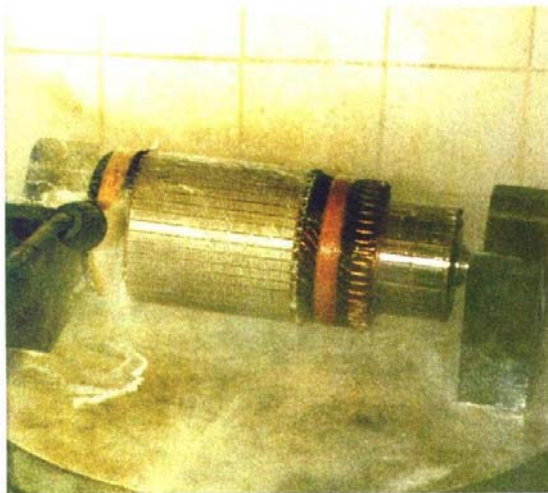
3) Na het dompelen in Carbonclean afspuiten met water.